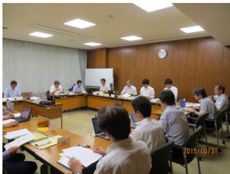
調査研究部会・会議風景

平成27年度は5回の会合を開催し、安全性を加味した生産システムの構築について検討した。具体的なモデルラインを設定し、ユーザ、インテグレータ、メーカーのそれぞれの立場から、生産システムを構築する上で必要な情報や留意すべき点について、機能面を中心に討議を行った後、人の介入が発生する作業の洗い出し及びガードをはじめとした安全防護の方針について検討した。