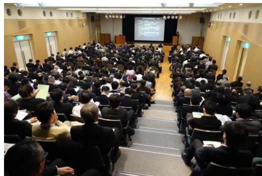
講演会・聴講風景